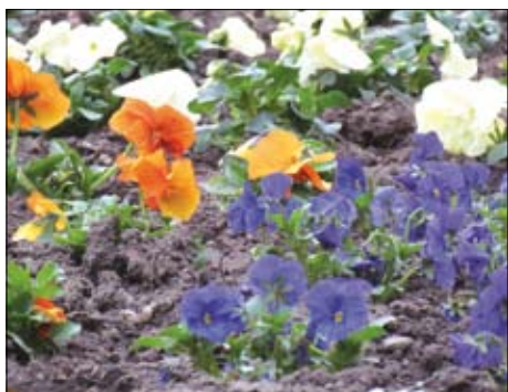
Frühblüher am Stadtpark.

Blumenschmuck in der Stadt sei nicht nur eine Angelegenheit des Technischen Eigenbetriebs, meint Blankenburgs Bürgermeister Hanns-Michael Noll. Er bittet deshalb alle Bürgerinnen und Bürger, ihre Vorgärten und Balkons im Frühjahr und Sommer mit blühenden Pflanzen zu schmücken, auch im Hinblick auf das Stadtjubiläum. „Schließlich wollen wir unserem Ruf als Blütenstadt gerecht werden“, so der Bürgermeister.