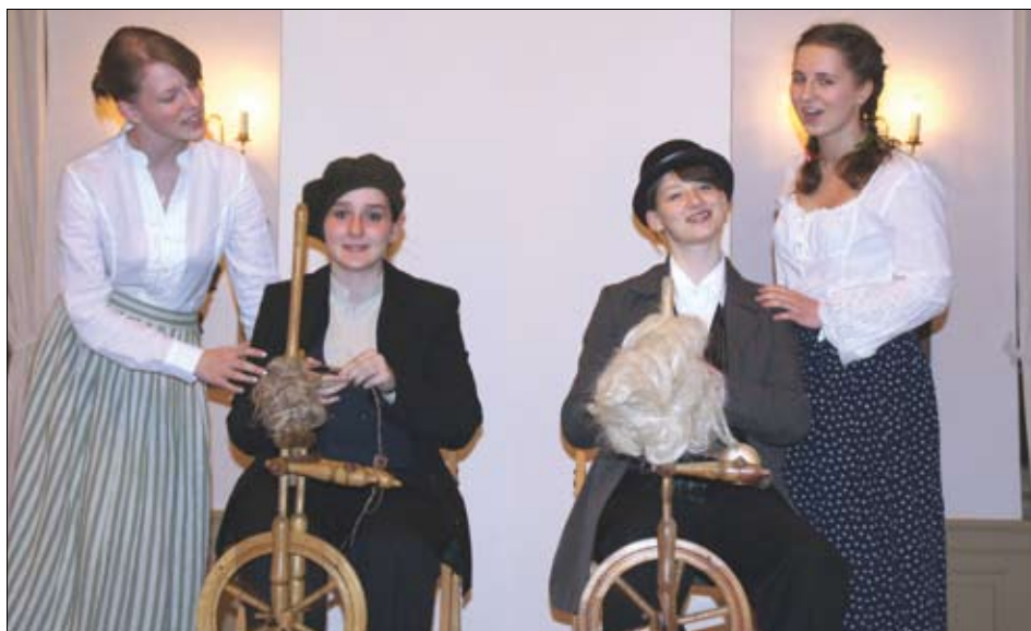
Eine Szene aus der komischen Oper „Martha“, dargeboten von den „Operini“.

Es wird daher allen Besuchern empfohlen, sich am Veranstaltungstag möglichst frühzeitig im Großen Schloss einzufinden, da von einem „ausverkauften Haus“ ausgegangen werden darf.