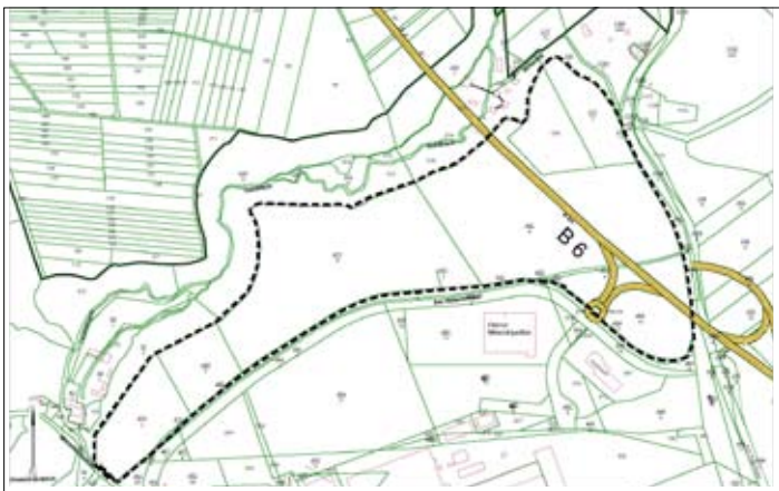
Flurkartenauszug mit dem Geltungsbereich der beabsichtigten Aufhebung des Teilbauungsplanes Nr. B 05a/96 "Harz-Therme, Blankenburg (Harz)"

Gemarkung Blankenburg Flur 48 N unmaßstäblich