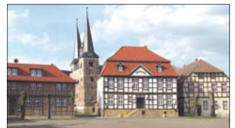
Die Derenburger feiern im Juli rund um Rathaus und Kirche.