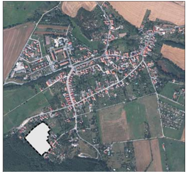
Ortslageplan Wienrode mit dem Geltungsbereich des Bebauungsplanes Nr. B 01/11 "Wohngebiet Ginsterkopf, Wienrode"

Gemarkung Wienrode Flur 8 ↑ N unmaßstäblich