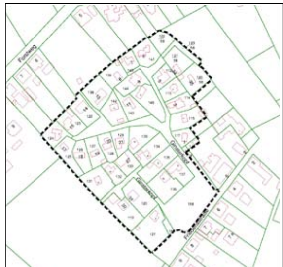
Flurkartenauszug mit dem Geltungsbereich des Bebauungsplanes Nr. B 01/11 "Wohngebiet Ginsterkopf, Wienrode"

Gemarkung Wienrode Flur 8 ↑ N unmaßstäblich