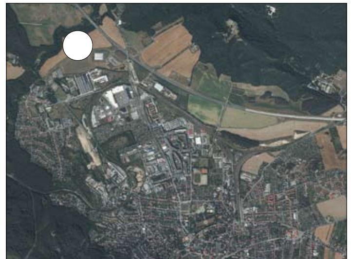
Ortslageplan Blankenburg (Harz) mit dem Geltungsbereich des Teilbauungsplanes Nr. B 05a/96 "Harz-Therme, Blankenburg (Harz)"

Gemarkung Blankenburg Flur 48 N unmaßstäblich