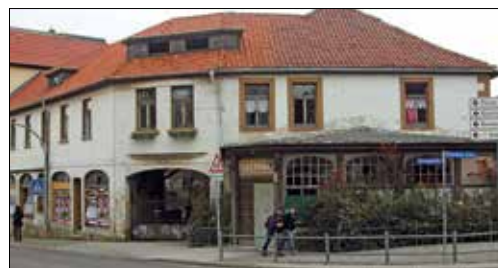
Das Forsthaus an der Herzogstraße.

Möglich macht es das Förderprogramm „Soziale Stadt“, aus dem in Blankenburg (Harz) bereits die Schulmensa im ehemaligen Kirchsaal an der Lühnergasse eingerichtet werden konnte. Voraussetzung sei, dass das Gebäude einem sozialen Zweck diene, zum Beispiel für altersgerechtes Wohnen, so der Bürgermeister, der dafür gute Chancen sieht: „Viele ältere Menschen wohnen gern im Zentrum und alle wichtigen Versorgungseinrichtungen sind in der Nähe.“ Für eine Senioreneinrichtung dort gebe es bereits Interessenten. Die Stadtverwaltung bemühe sich darum, das Haus zu erwerben, nachdem der Stadtrat bereits grünes Licht gegeben habe. Alle Auflagen des Denkmalschutzes müssen natürlich erfüllt werden. „Wir wollen einen städtebaulichen Missstand beseitigen“, betont der Bürgermeister.