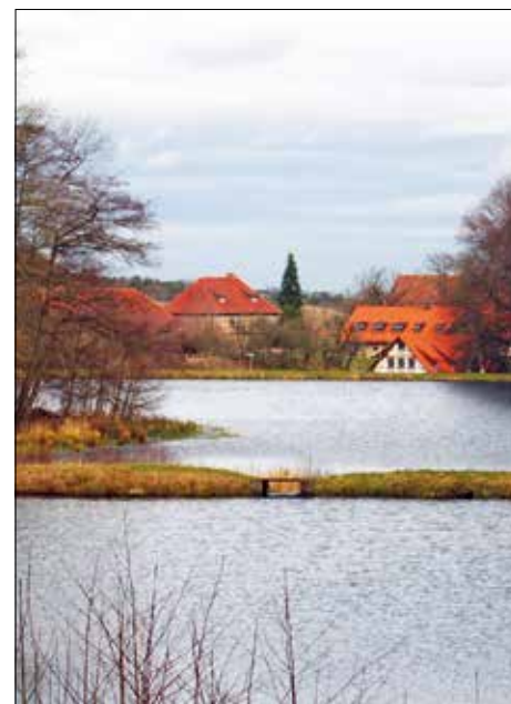
Teiche am Kloster Michaelstein.