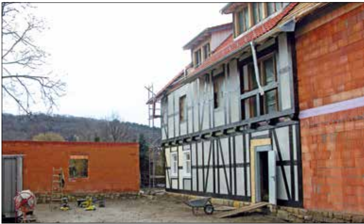
Die alte Mühle steht bereits. Rechts der Anschluss für die noch zu bauende Scheune. Links wird zurzeit noch am Rohbau der Remise gearbeitet.

Erst vor wenigen Monaten wurden an der Blankenburger Mühlenstraße gleichzeitig die Grundsteinlegung und das Richtfest für die Neuentstehung des historischen Gebäudekomplexes „Zimmermanns Mühle“ gefeiert. Voraussichtlich im August dieses Jahres soll der neue Wohnpark seiner Bestimmung übergeben werden.