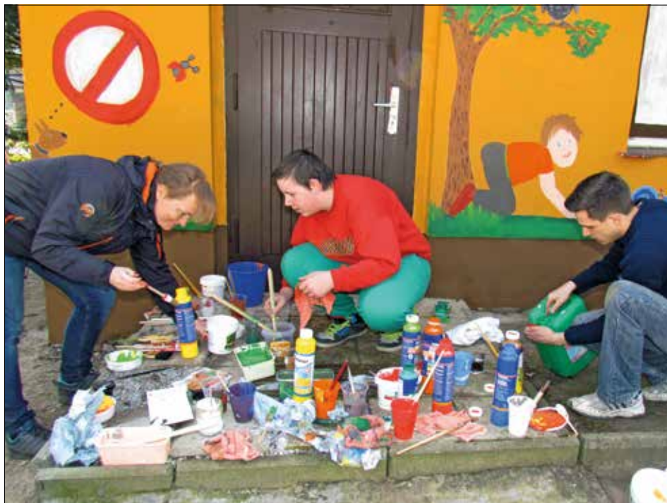
Nach Ideen der Blankenburger Grundschüler werden die Wände des Toilettenhäuschens mit farbigen und fantasievollen Motiven verschönert.