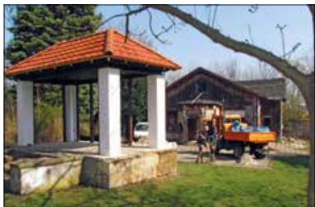
Auch der kleine Pavillon im Stadtpark wurde renoviert.