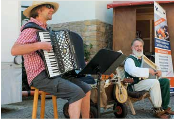
„Ach und Krach“ unterhalten in der Katharinenstraße mit ihren musikalischen Darbietungen.