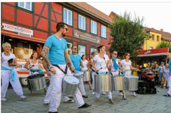
Fast schon Dauergäste sind die temperamentvollen Trommler von Baraban.