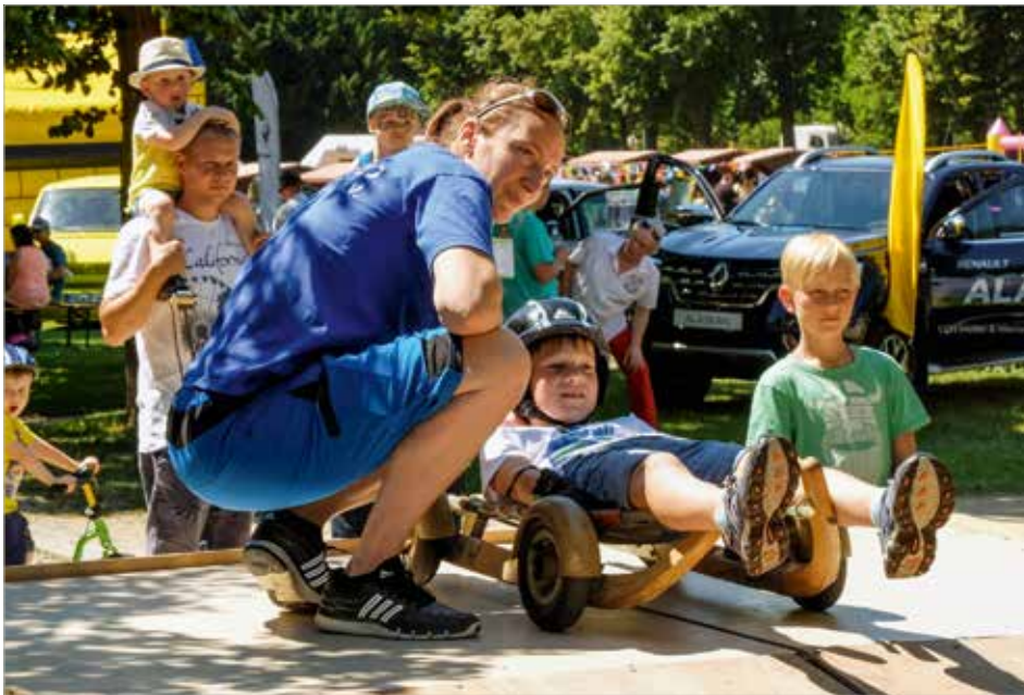
Vor dem Start beim Sommerrodeln bekommt Paul (8) eine gründliche Einweisung von Olympiasiegerin Tatjana Hüfner.