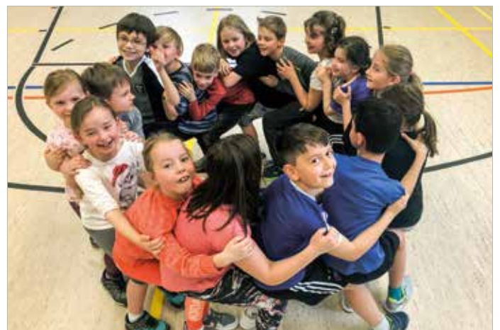
Sichtlich viel Spaß hatten die Kinder bei den gemeinsamen Rollen- und Teamspielen.