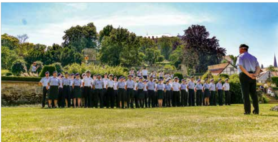
Bereits zum dritten Mal fand vor der wunderschönen Kulisse in unserem Barocken Schlossgarten der Zentrale Beförderungsapell der Bundeswehr statt.

Flottillenadmiral Christoph Müller-Meinhard, Unterabteilungsleiter Haushalt und Controlling II im Bundesministerium der Verteidigung in Bonn und Festredner des Beförderungsap-