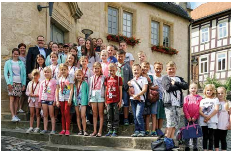
Die Kinder mit ihren Betreuern und Bürgermeister Heiko Breithaupt vor dem Blankenburger Rathaus.

Am 19. Juli ging es per Flugzeug zurück in die Heimat, eine Region, die noch heute mit den Folgen der Atomkatastrophe von Tschernobyl zu kämpfen hat. Denn hier ging ein Großteil des radioaktiven Niederschlags nach der Explosion des ukrainischen Atomreaktors nieder.