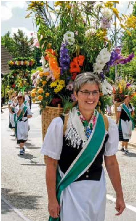
So bunt wie im letzten Jahr soll es auch dieses Mal wieder beim Grasedanz zugehen. Hier eine der Umzugsteilnehmerin mit ihrer geschmückten Kiepe.

Eines der schönsten Harzer Brauchtums- und Volksfeste findet alljährlich in Hüttenrode statt. In diesem Jahr laden die Grasedanz-Frauen von Freitag, 2., bis Montag, 5. August, in den Harzort ein, denn für die Zeit des Fests herrscht dort das „Frauenrecht“. Der Grasedanz erinnert an die Zeit, als die Männer des Ortes im Bergbau arbeiteten, und die Frauen für Haus und Hof, also auch für die Versorgung der Tiere, zuständig waren.