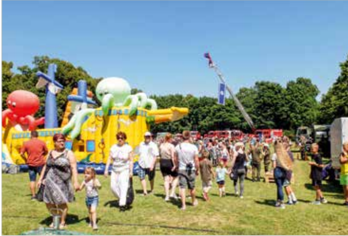
Über ein sehr gut besuchtes Fest im Thiepark bei strahlendem Sonnenschein können sich die Organisatoren freuen.