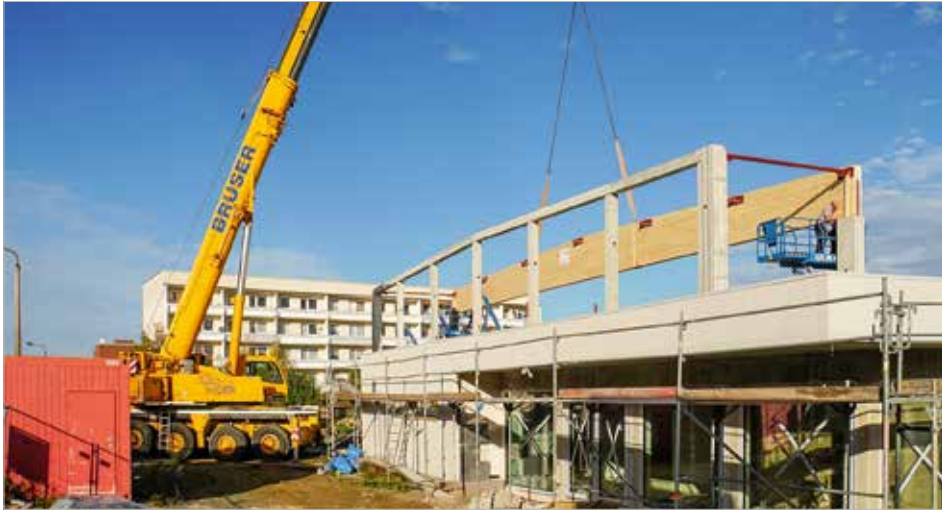
Präzisionsarbeit verlangte die zentimetergenaue Montage der schweren Dachbinder am Turnhallenrohbau.