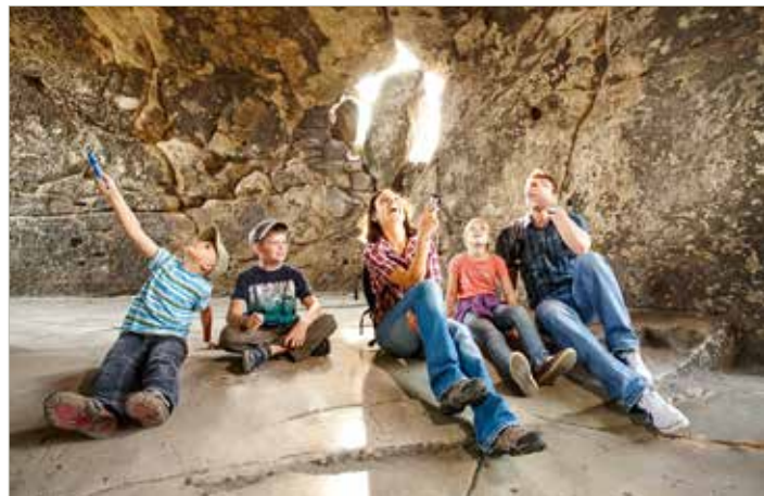
Auf dem Regenstein gibt es jede Menge zu entdecken, während der Corona-Pandemie gab es einen regelrechten Besucheransturm auf die historische Anlage.

Dass der Harz aufgrund der Coronasituation bei Touristen noch beliebter als sonst zu sein scheint, zeigt ein Spaziergang durch die Wälder, die in diesem Jahr deutlich belebter waren. Eine von Blankenburgs Stärken liege in der umgebenden Landschaft und den vielen Wandermöglichkeiten, weiß Dagmar Kamp. Darum würden durch einen Partnerbetrieb und den Mitarbeitern des Projektbüros der Harzer Wandernadel die Wanderwege wöchentlich abgegangen, um Reparaturen umgehend auszuführen und Müll zu beseitigen. Schilder wür-