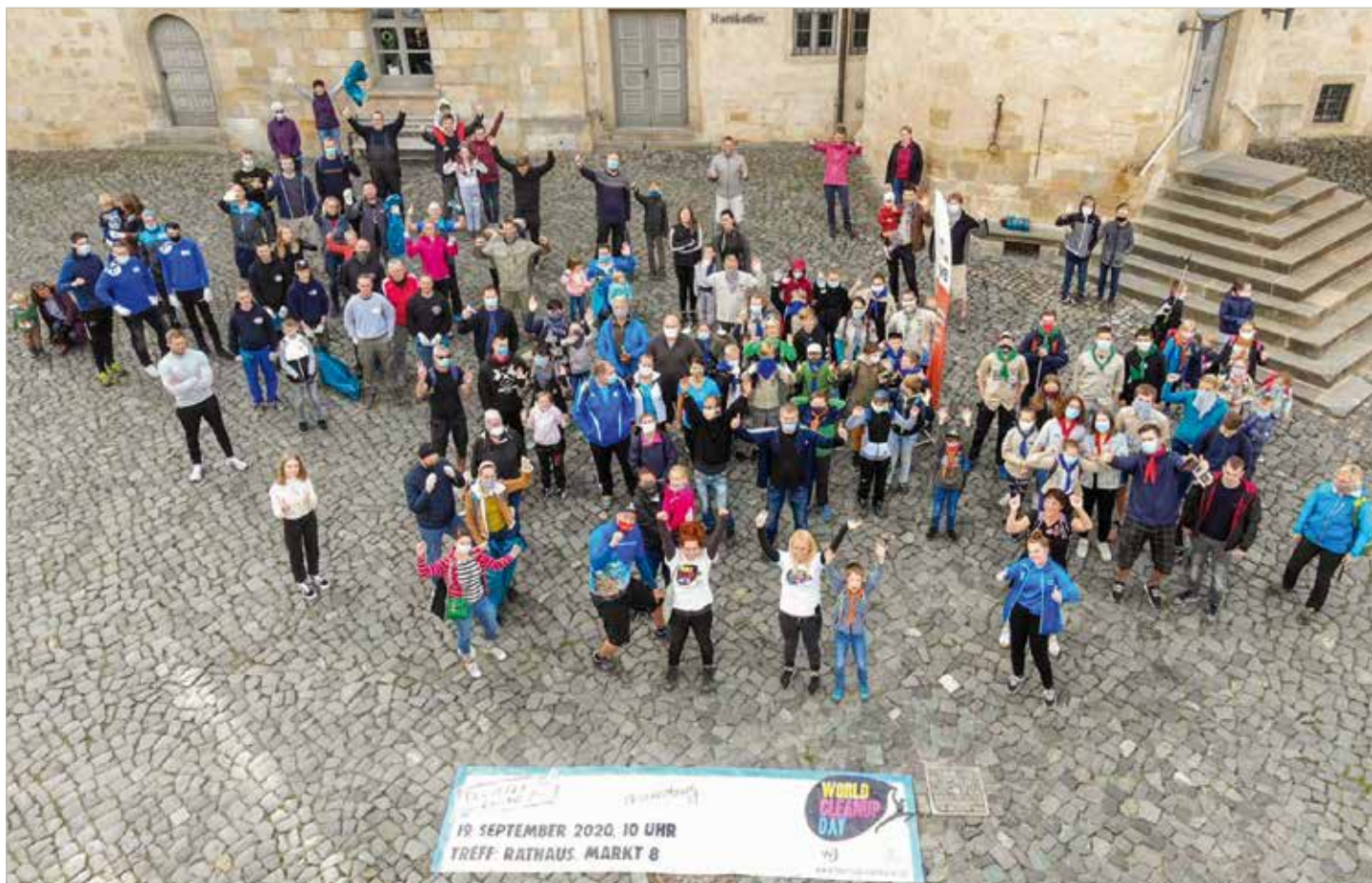
Zahlreiche Helfer fanden sich trotz Corona-Pandemie ein, um in Blankenburg aufzuräumen.