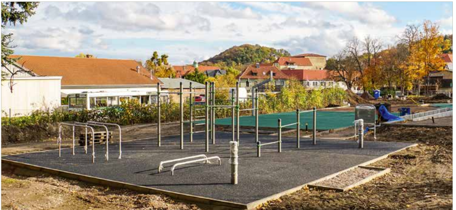
Nicht nur spielen wird im neu gestalteten Sport- und Fitnessbereich des Stadtparkes möglich sein, auch für die sportliche Betätigung wird es viele verschiedene Möglichkeiten geben.

Mit den Arbeiten wird nicht nur die Bausubstanz gesichert auch das Erscheinungsbild des Denkmals wird deutlich aufgewertet. Die Sanierungsarbeiten sollen noch in diesem Jahr beendet werden, insgesamt belaufen sich die Kosten für den dritten Bauabschnitt auf rund 719.000 Euro. Die Mittel stammen aus dem Bund-/Länderprogramm zur „Förderung von Maßnahmen des städtebaulichen Denkmalschutzes zur Sicherung und Erhaltung historischer Stadtkerne“.