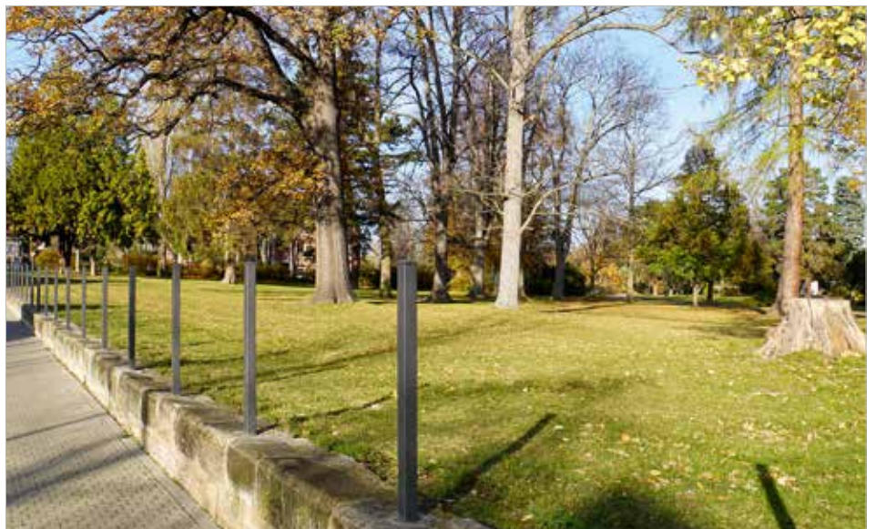
Aus Gründen der Ordnung und Sicherheit, und um Vandalismus entgegenzuwirken, erhält der Stadtpark einen Zaun.

aufmerksam durch den Park gegangen ist, konnte die Handwerker beim Errichten des neuen Spiel- und Fitnessbereiches beobachten. Hier entsteht für alle Altersgruppen ein großer Bereich zum Spielen, Toben und für sportliche Aktivitäten. Bereits jetzt ist gut zu erkennen, wie groß und abwechslungsreich das neue Freizeitareal gestaltet wird. Erste Geräte wie die Calisthenics-Anlage, ein großer Kletterturm, Bodentrampoline und ein Kleinfeldspielplatz wurden bereits errichtet. Weitere Geräte wie der riesige Kletterfelsen, der vielfach gewünschte Matsch- und Wasser-Spielplatz und eine Seilrutsche kommen noch hinzu.