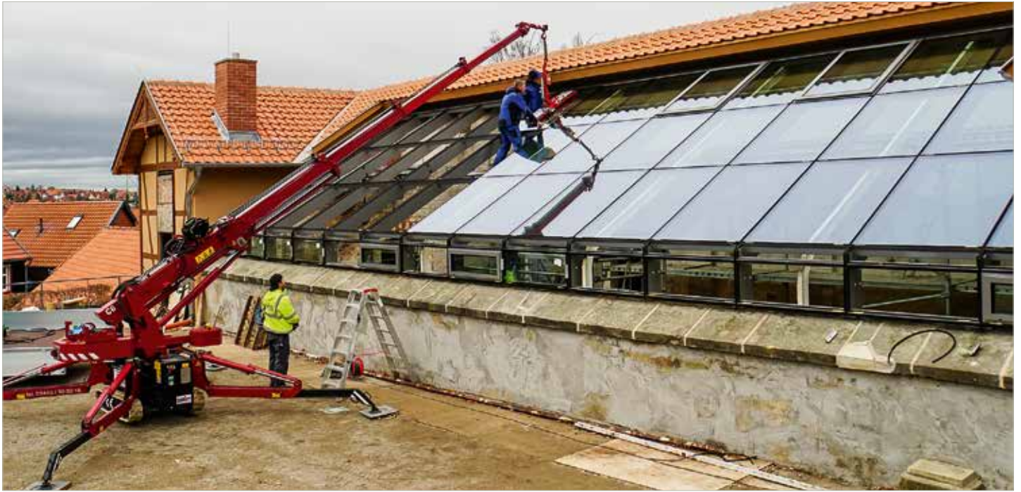
Das neue Glasdach über der Orangerie lässt das historische Gebäude in neuem Glanz erscheinen.

Ticket-Schalter und ein Lager und Verleihraum für Spielgeräte entstehen. Die Arbeiten sollen im nächsten Jahr beginnen. Insgesamt werden circa 1.700.000 Euro im Stadtpark investiert. Ca. 1.130.000 Euro der Mittel stammen aus dem Programm „Zukunft Stadtgrün“ des Landes Sachsen-Anhalt.