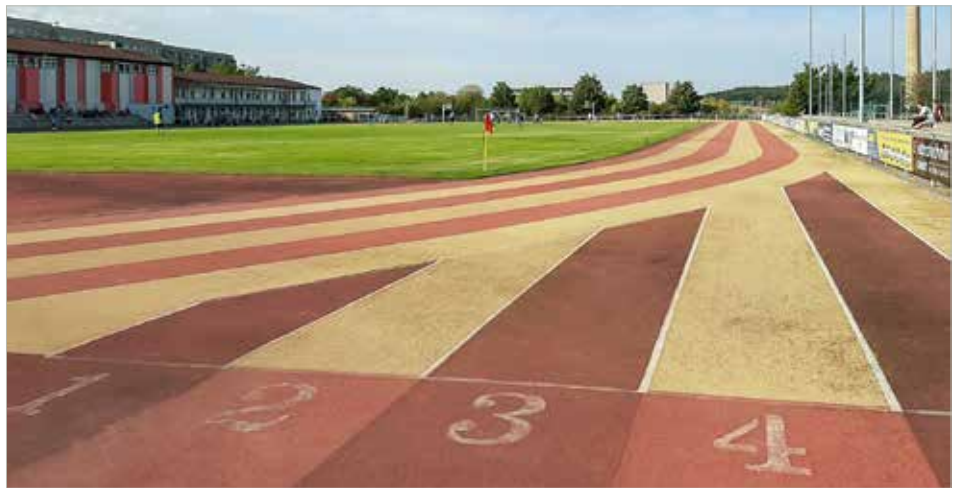
Die in die Jahre gekommene Leichtathletikanlage im Sportforum, kann dank der Bundesförderung, umfangreich saniert werden.