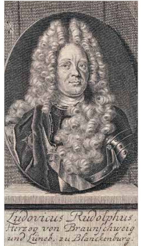
Porträts von Herzog Ludwig Rudolf und Herzogin Christine Luise von Braunschweig-Wolfenbüttel, Kupferstiche, 18. Jh.

paars, den späteren Kaiser Karl VI. heiraten wird.