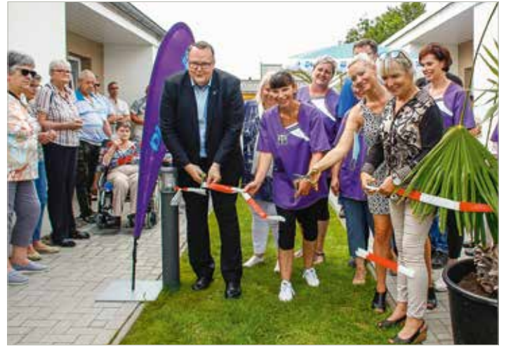
Mit einem symbolischen Scherenschnitt wurde der Wohnpark „neues Wohnen“ offiziell an seine neuen Bewohner übergeben.