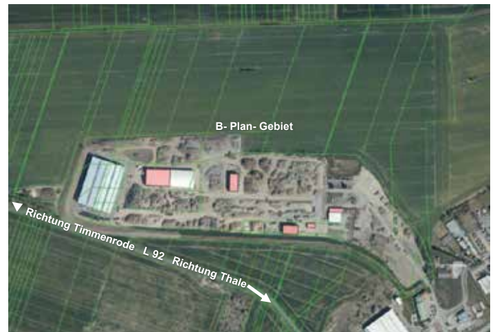
Luftbild zur Lage des B-Plan-Gebietes (an der nordwestlichen Grenze des Gewerbegebietes Thale)