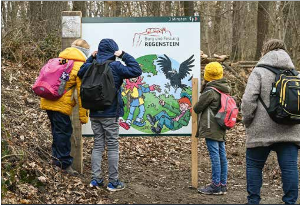
Eine der fünf Tafeln mit der Brockenbande auf dem Weg zur Burg und Festung Regenstein, die den Kindern mit Informationen und kleinen Aufgaben den Aufstieg verkürzen.

Eine der eindrucksvollsten Sehenswürdigkeiten Blankenburgs und des Harzes ist zweifelsohne die Burg und Festung Regenstein. Das Freilichtmuseum macht verschiedene in den Fels gearbeitete Räumlichkeiten zugänglich und erzählt die Regensteiner Geschichte anhand unterschiedlicher Ausstellungsstücke. Mittels einer sogenannten Augmented-Reality-App wird die Festungsanlage sogar virtuell erlebbar und macht die frühere Bebauung sichtbar. Gekrönt wird die Anlage mit einem beeindruckenden Blick weit über das Harzvorland bis hin zum Brocken und das Große Schloss Blankenburg.