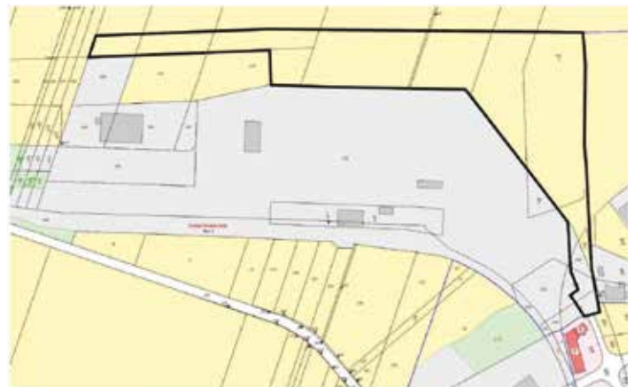
Geltungsbereich B-Plan Nr. 03/23 Gewerbegebiet Timmenrode Lärm- und Staubschutzwall, o. M. Quellenvermerk: © GeoBasis-DE / LVermGeo LSA, [Stand 07/2022, Az. A18/1-18810/2009]