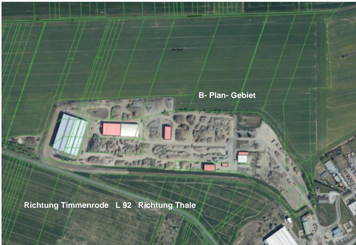
Luftbild zur Lage des B- Plan- Gebietes (an der nordwestlichen Grenze des Gewerbegebietes Thale)