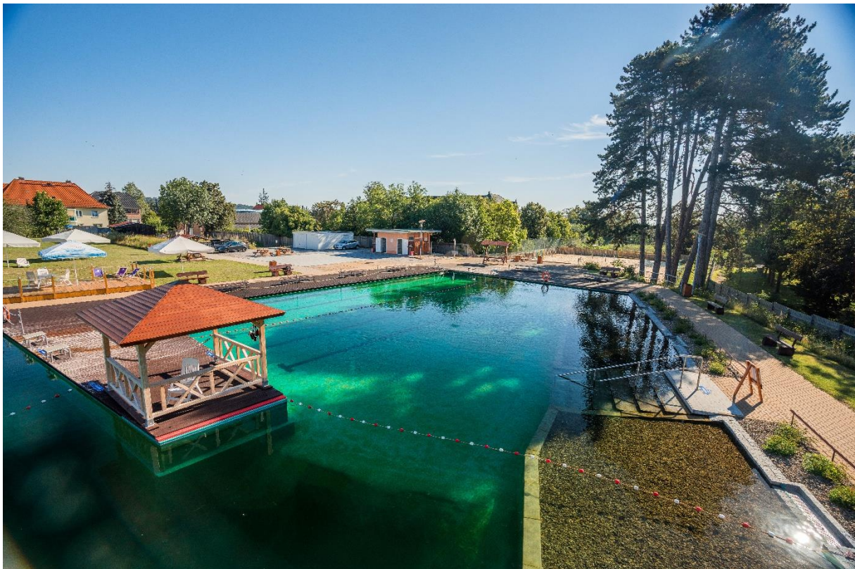
Abbildung 1: Schwimmerbecken, Liegewiese, Toiletten und Beachvolleyballplatz im Biologischen Freibad "Am Thie"

Ein Parkplatz befindet sich in ca. 80 Metern Entfernung zum Eingangsbereich.