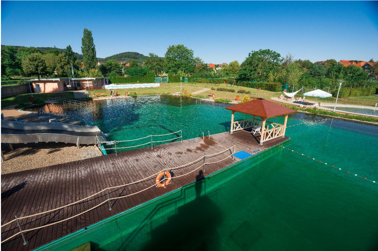
Abbildung 2: Rutsche, Nichtschwimmerbereich, Spielplatz, Kiosk und Eingangsbereich im Biologischen Freibad "Am Thie"